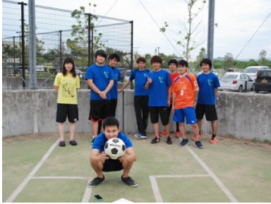
サッカー・フットサル部

航空保安大学校では、現在9つのクラブ活動があります。 授業後楽しく活動し、親睦を深めています。