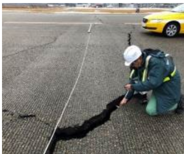
空港基本施設(滑走路等)の調査