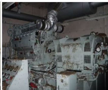
航空保安施設用予備発電設備の調査