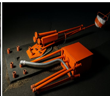
航空灯火電気施設の調査