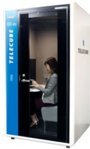
テレキューブイメージ