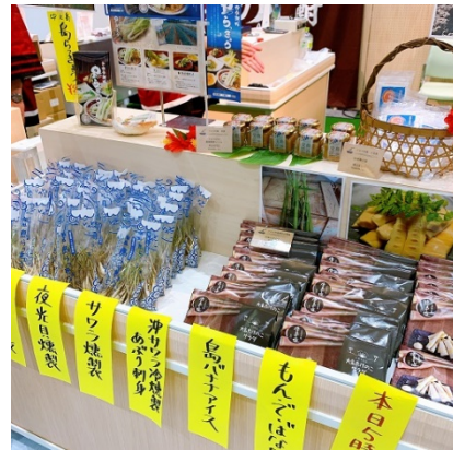
【6月11日・12日 伊佐市の様子】