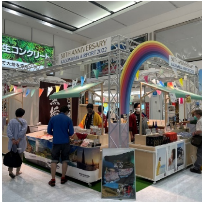
【6月4日・5日 三島村の様子】