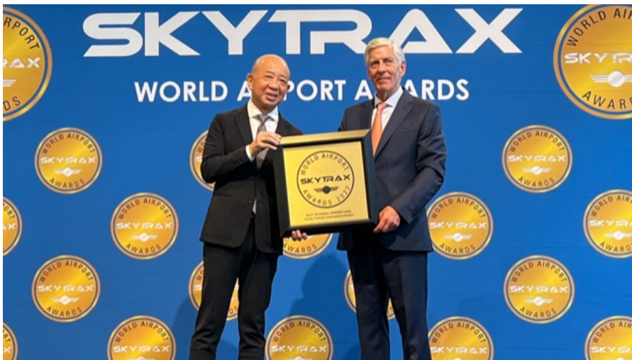
↑授賞式の様子（6月16日、フランス・パリ Expo Porte de Versailles にて）

参照) セントレア公式 HP： https://www.centrair.jp/special/skytrax/award/