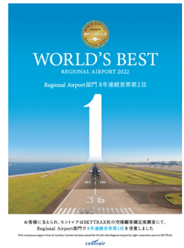
↑受賞の記念に制作したポスター