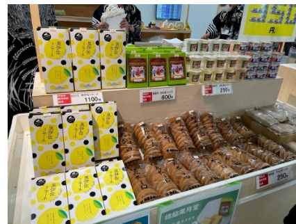
【6月18日・19日 南大隅町の様子】