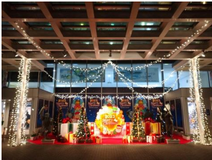
○阿波踊り像周辺 全景