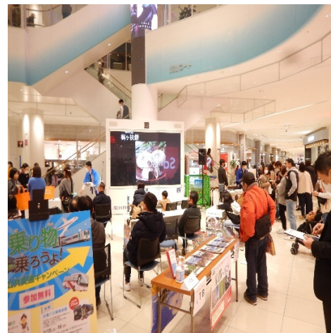
↑ イベント当日の様子 ↑

当該イベントには、福岡＝徳島路線のPRを目的に、福岡空港利活用推進協議会がブースを出展。同協議会ブース内では、ノベルティの配布や、福岡空港公式 SNS アカウントの紹介等を行った。