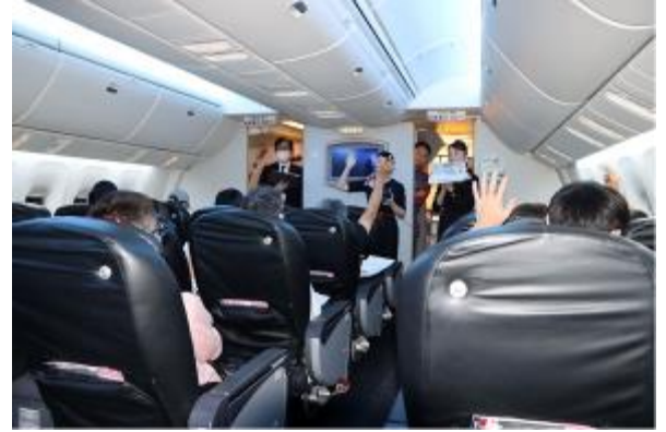
機内でのクイズ大会