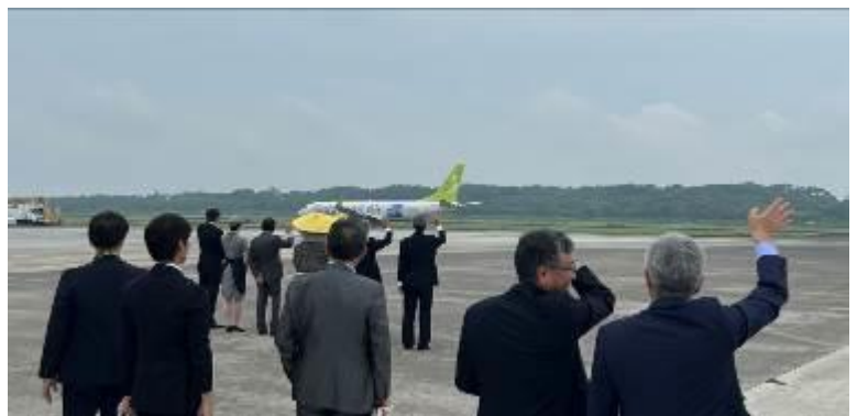
エプロンサイドでお見送り