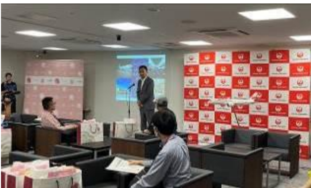
日本航空 中原支社長