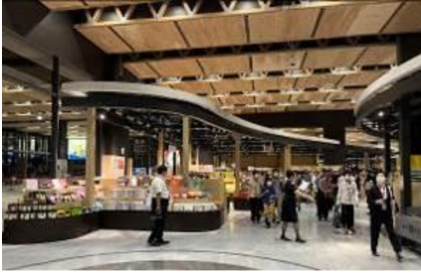
ゲートラウンジ案内