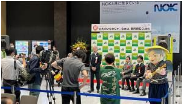
南阿蘇村 吉良村長