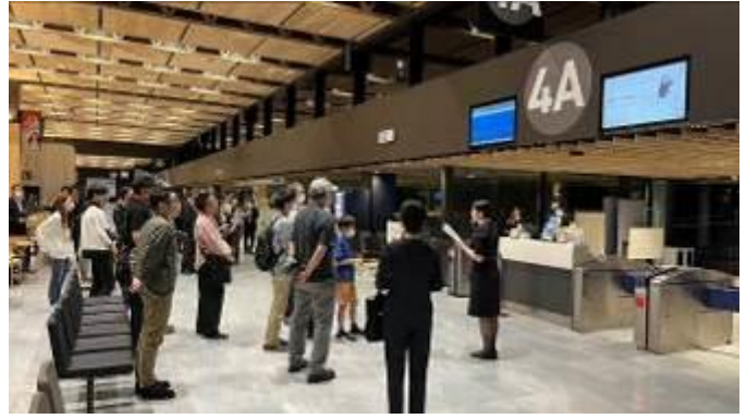
搭乗ゲート前スペシャル搭乗アナウンス