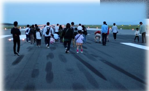
早朝のRWをウォーク