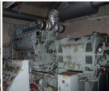
航空保安施設用予備発電設備の調査