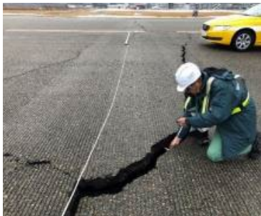
空港基本施設（滑走路等）の調査