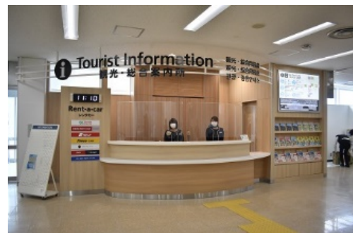
国際線ターミナルビル 総合案内所