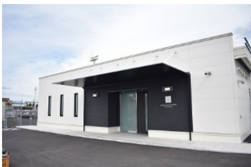
ビジネスジェット専用施設「桜島」外観