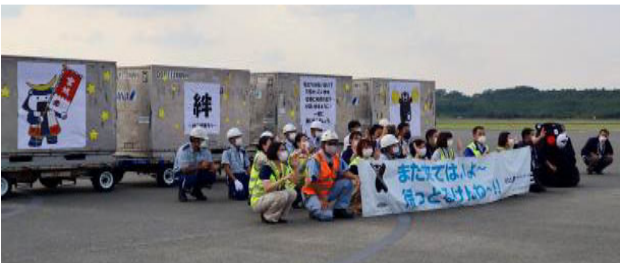
10/12 復路便、くまモンとのお見送り