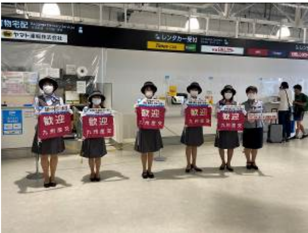
空港でのバスガイドさんのお出迎え

が催行されました。熊本発、仙台発の両区間でのチャーターツアー実施は初めて。まん延防止等重点措置が解除されてから間もない時期のツアーだったこともあり、熊本空港では当日に抗原検査を実施したうえでの出発となりました。ツアー初日、阿蘇くまもと空港では出発便、および仙台空港からの到着便において、見送りとお出迎えを実施しました。