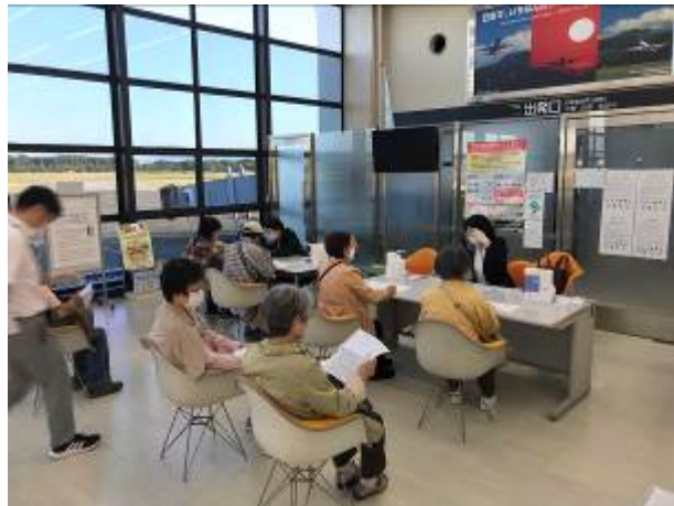
国際線ターミナルを活用した抗原検査